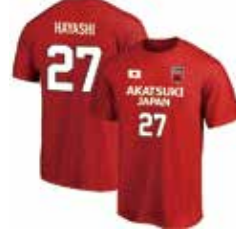
ネーム&ナンバーTシャツ ¥4,900