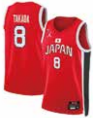
レプリカユニフォーム ¥25,000