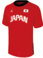
ジョーダン 日本代表着用 セカンダリーシャツ ¥8,910