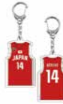
ユニフォーム型 アクリルキーホルダー ¥990