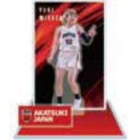
アクリルスタンド ¥1,800