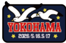
ワッペン YOKOHAMA ¥700