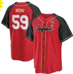
ベースボールシャツ RED ¥10,000