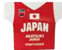
ユニフォーム型 応援クッキー ¥1,300