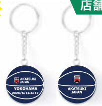
YOKOHAMA ボールキーチェーン ¥1,100