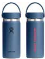
HydroFlask 16 oz Wide Mouth ¥5,600