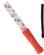
【音響制御】AKATSUKI マジカルペンライト ¥3,800